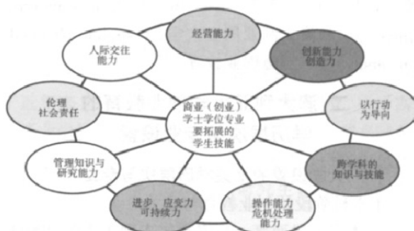
图2 墨尔本皇家理工大学商业(创业)学士学位专业致力于拓展的学生技能的教学内容

墨尔本皇家理工大学设置的商业(创业)学士学位是一个涉及创业以行动为导向的专业，该专业主要致力于拓展学生的知识、培养创业能力、增强信心以及帮助学生树立风险投资意识并获取驾驭企业运作的相关能力。该专业计划拓展的学生能力主要如图2所示。