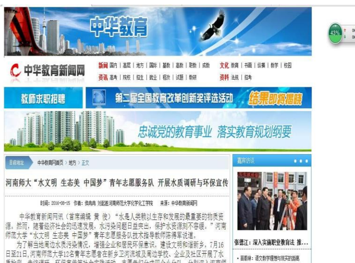
暑期实践团队被中华教育网报道