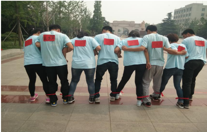
青春无限，激情飞扬

为积极引导我班同学保持健康向上的心理状态，我班特意制定了有关工作计划，开展一些心理教育活动。并定期对大家进行心理健康普查，了解同学们的心理健康状况以及心理发展规律，同时积极关注同学们的思想动态，让团支书以及心理委员及时对个别同学进行心理疏导，让良好的心理素质在每一位同学身上持久扎根。