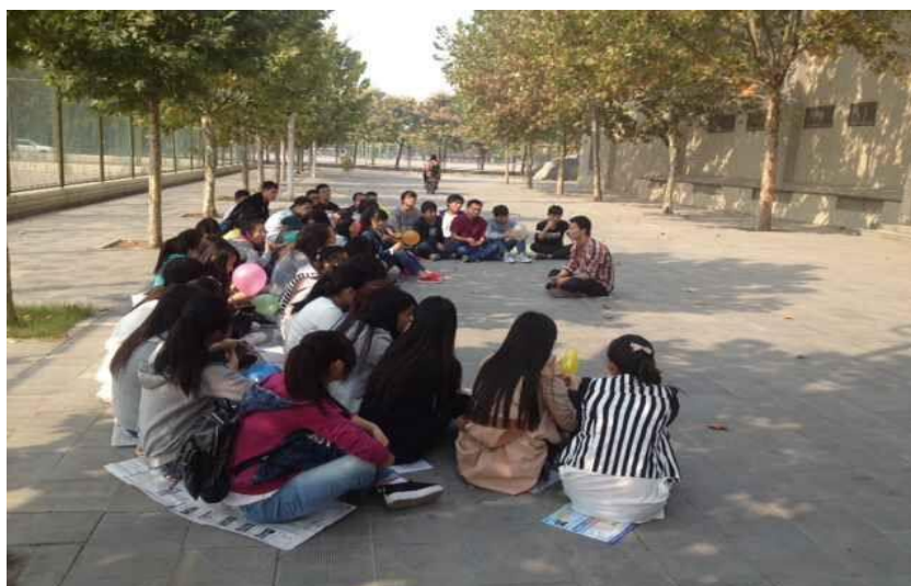
“安全警钟常鸣”主题班会

为同学安全负责，及时检查、消除安全隐患，教育大家牢固树立安全意识，增强自防、自护、自救的能力，从而保证日常工作健康有序进行。通过开展以“安全警钟常鸣”为主题的安全知识教育班会，增强班内学生的安全意识，懂得使用一些基本的校内外安全知识，达到积极预防事故的发生并提高同学基本自我保护的能力。