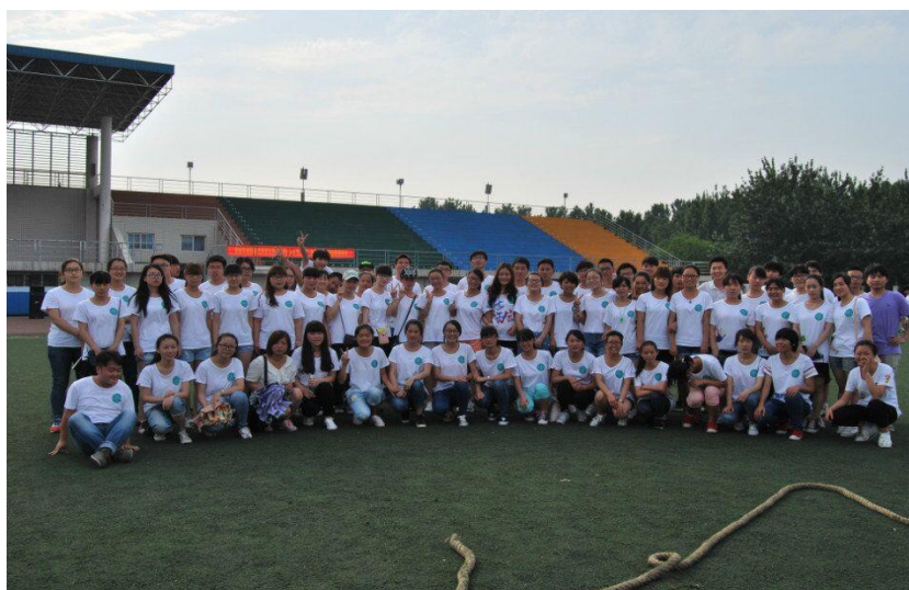
团结奋进的化工一班