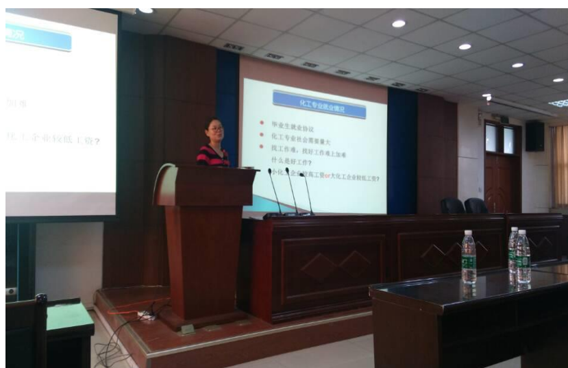
班主任在给大家传授经验

明确的学习目标可以为学生确定明确的努力方向！为了解决同学进入大学后学习的盲目性，我班邀请专业班主任为学生分析培养计划，指明前进目标，指导大家选择适合本专业的辅助课程，激发学生兴趣，促进我班班级学风的建设。