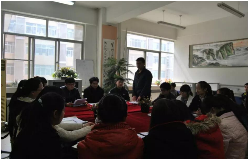
两学一做，争做优秀共产党员

我院积极响应上级党组织号召，启动了“两学一做”学习教育，引导学生、干部以学促做，进一步增强责任感和使命感，为学校、学院事业持续健康发展提供精神动力和智力支撑。开展“两学一做”学习教育是加强党的思想政治建设的一项重大部署，是推动全面从严治党向基层延伸的有力抓手，是推动党内教育常态化制度化的重要实践。