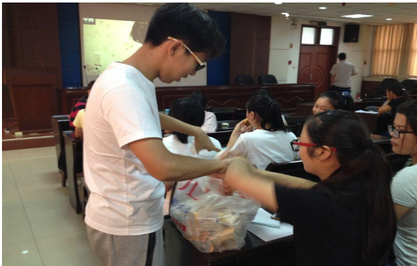
花好月圆，中秋情浓