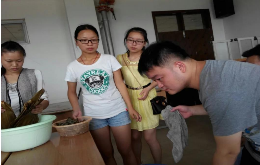
传承文化，欢度端午

一年一度端午至，又是龙舟飞渡时。在这个特殊的节日里，大家聚在一起，包粽子，猜字谜，表演节目，好不热闹。通过此次活 动，传承了中华民族的文化精髓，弘扬民族传统底蕴，促进班集体 同学之间的团结，让同学们更加活力四射，斗志昂扬。