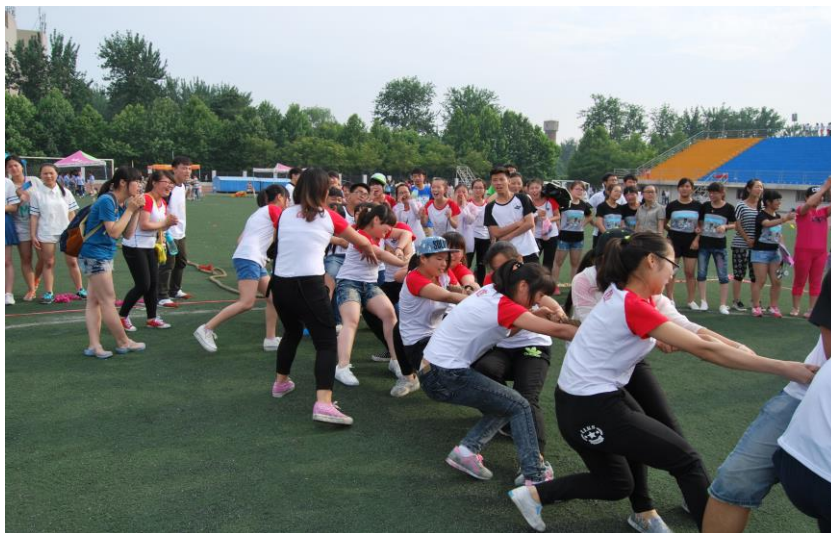
同学们在奋力拔河

为了丰富学生的校园文化生活，促进学生走出寝室、走进操场健康成长，我们举办了“we are 伐木累”趣味运动会。通过活泼、快乐的运动形式以激发学生参与的兴趣，活动中项目多是大家喜闻乐见的游戏，为运动会增添不少童年的趣味，学生参与的热情很高，在游戏中享受运动的趣味，体会到运动的意义，也加强了我班的凝聚力。