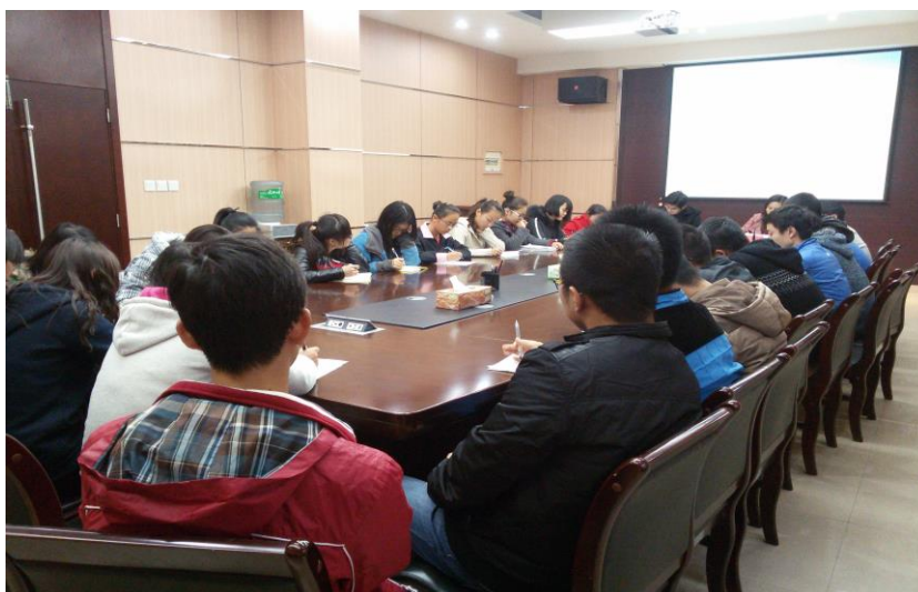
大家的经验交流会