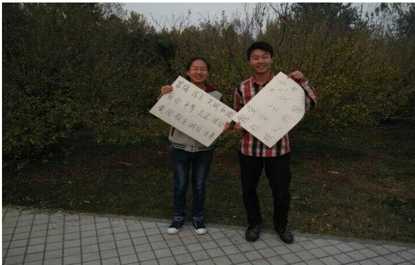
社会主义核心价值观宣传

我院积极响应上级党组织号召，启动了“两学一做”学习教育，引导学生、干部以学促做，进一步增强责任感和使命感，为学校、学院事业持续健康发展提供精神动力和智力支撑。开展“两学一做”学习教育是加强党的思想政治建设的一项重大部署，是推动全面从严治党向基层延伸的有力抓手，是推动党内教育常态化制度化的重要实践。