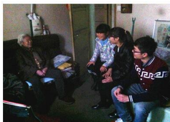
青春伴夕阳活动被我院报道