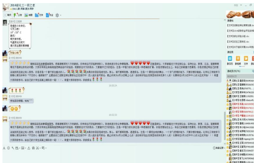
班级 QQ 截图