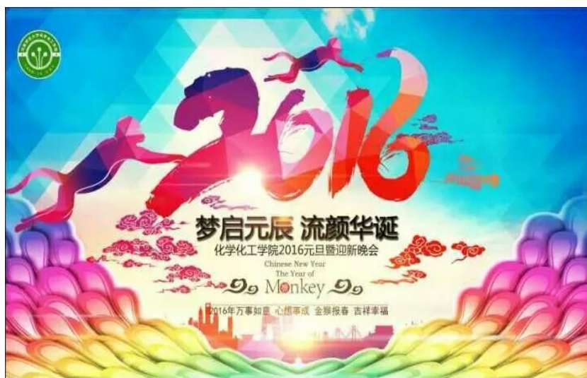
化学化工学院 2016 元旦晚会

新的一年，我们拥有更多新的期待，先为自己立下一个小目标，我们就做更加优秀的自己！新的一年，我们在一起，新的一年我们一起起航！