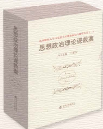
马克思主义理论研究与教学丛书