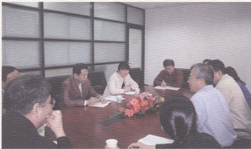
教育部有关部门负责同志来校与思想政治理论课教师座谈

北京师范大学马克思主义学院有一支优秀的思想政治理论课教学队伍，在思想政治理论课程建设和马克思主义理论一级学科建设上取得了突出的成绩。他们将思想政治理论课程建设、马克思主义理论一级学科建设与教师队伍建设结合为一个整体，构成其发展建设的特色。在课程建设上，着重抓好四门思想政治理论课的理论体系和教材教学体系建设，重点建设了“毛泽东思想和中国特色社会主义理论体系概论”等国家级精品课；在马克思主义理论一级学科建设上，先期启动了马克思主义基本原理、马克思主义发展史、马克思主