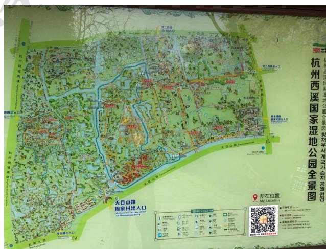
图 3 西溪国家湿地公园现状图