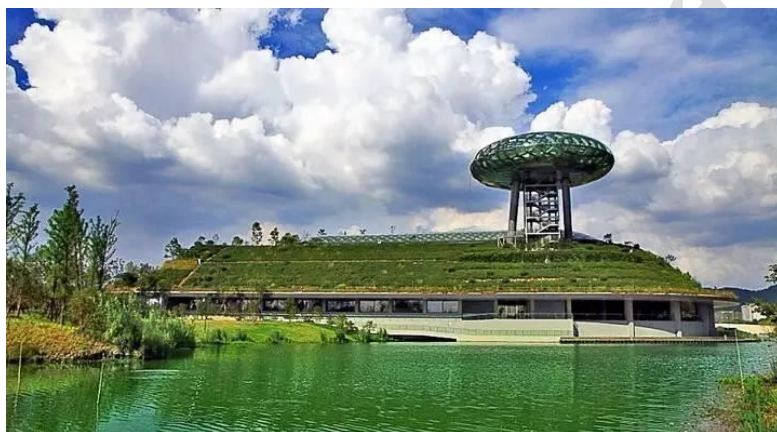
图 2 中国湿地博物馆