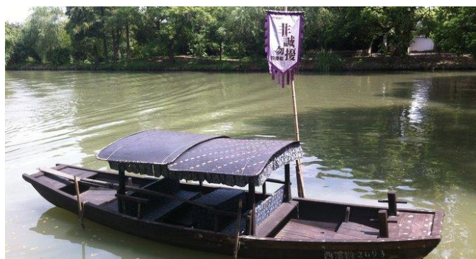
图 4 西溪湿地《非诚勿扰》场景