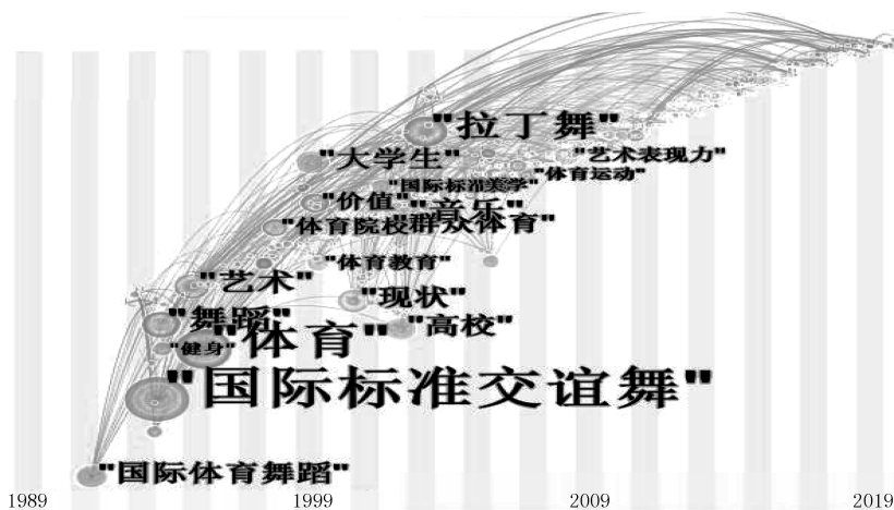
图2 我国体育舞蹈研究热点时区视图

研究内容是随着时间推移和研究深入而逐渐发展变化的。这种不断演进的发展趋势可以通过时区视图直观地展现出来,时区视图能从时间维度上表示体育舞蹈研究内容的动态演进过程。借助 CiteSpace V 软件,将文章的标签(Article Label)中词频阈值(Threshold)定为6,节点标签尺寸(Front Size)定为2,节点大小(Node Size)定为170,制作时区视图 [3] 。图2中,各圆圈的大小表示着关键词出现频次(frequency)的多少,圆圈越大即说明该关键词被引用的频次越高。圆圈中最外层表示中心性(centrality) [20] 。通常来说,被引频次与中心性都较高的节点就是体育舞蹈研究者共同所关注的问题,是体育舞蹈研究领域的热点。根据图2可以看出我国体育舞蹈近30年的研究进程可分为3个阶段。