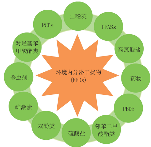
图2 日常生活中常接触到的内分泌干扰物 [35]

EEDs 又称环境激素,是指能通过干扰生物体内激素的合成、分泌、运输和调节等过程,引起母体和(或)其后代发生不利变化,如生殖、发育、神经和免疫系统紊乱等的外源性物质 [12] .日常生活中常见的 EEDs 如图 2 所示,有广泛用作工业制造塑料和食品罐头包装原料的双酚类 [6] ,燃料或废物燃烧过程、杀虫剂和农药生产过程中产生的二噁英类(dioxins) [13] ,用作增塑剂的邻苯二甲酸酯类(phthalates),高氯酸盐(perchlorate) [14] ,有机磷酸酯类阻燃剂(organophosphates) [15] , PFASs [16] ; 雌激素类 [17] ,溴系阻燃剂多溴联苯醚类(PBDE) [18] ,多氯联苯类(PCB) [19] ,用作防腐剂的对羟基苯甲酸酯类(parabens) [20] ,农药以及杀虫剂等 [21] .另外,随着发展需求的不断升级,新近发现的具有潜在内分泌干扰效应的物质清单还在持续增加。